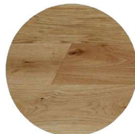
Fortement structuré sur le chanfrein en bout de lames