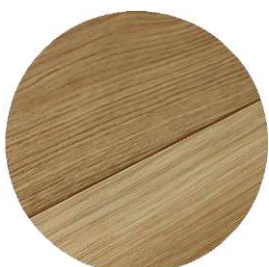
Très fortement structuré (aspect "relief")